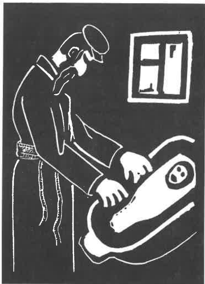
תחריט: חיים זלצר