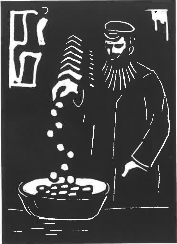
תחריט: חיים זלצר