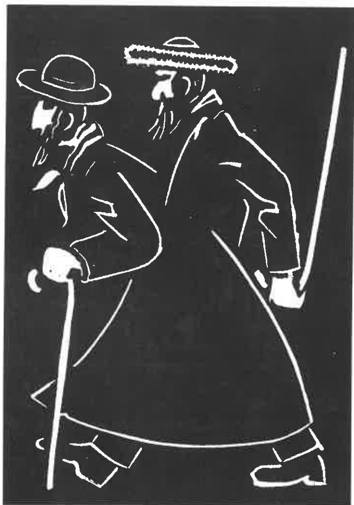
תחריט: חיים זלצר